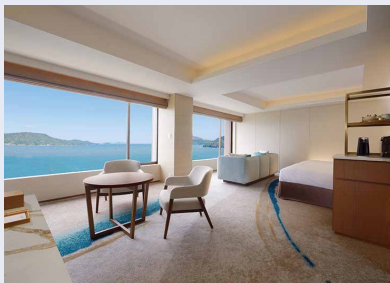
鳥羽国際ホテル オシャンビュースイート・クラブ