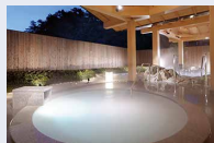
潮路亭 パールオーロラ風呂